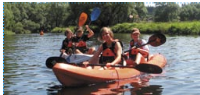
Kanufahrt auf dem Regen