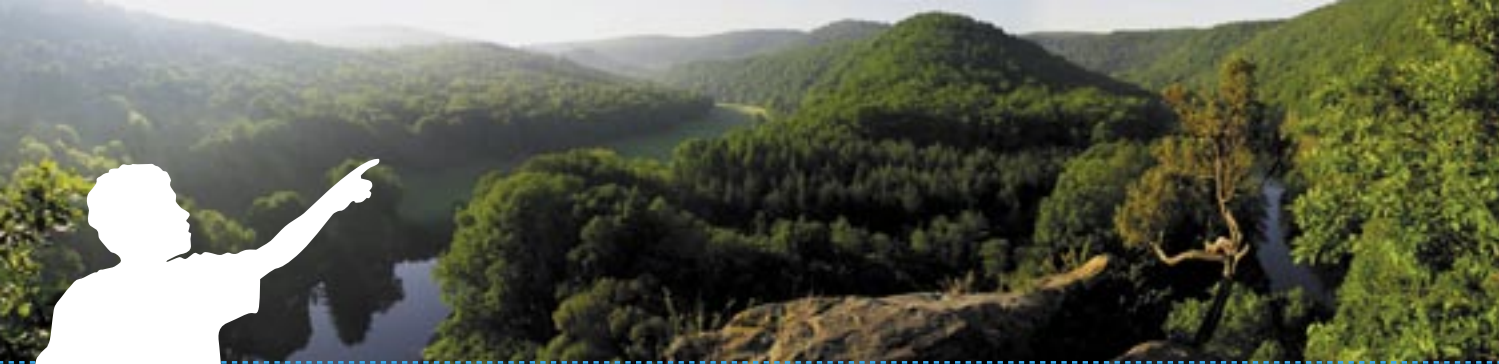
Panorama Thayatal