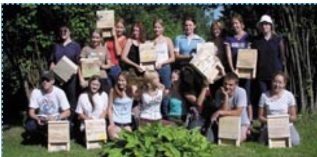
Selbst gemachte Vogelhäuser, Foto: Nationalpark Gauja

Bewerbungen bitte an die Föderation EUROPARC.