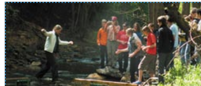
Bachüberquerung, Foto: Nationalpark Thayatal