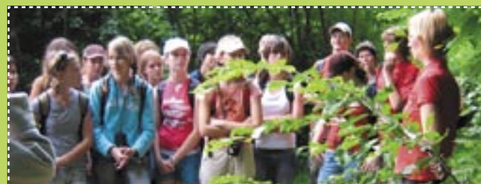
Im Nationalpark

Im Modellprojekt „Schüler erleben Natur in europäischen Schutzgebieten“ entwickelt EUROPARC zusammen mit zehn grenzüberschreitenden Nationalparks in Deutschland (Bayern), Österreich, Polen und Tschechien jeweils ein attraktives Programm für eine 5-tägige Klassenfahrt. Die Programme wurden speziell für das Projekt entwickelt und auf die Bedürfnisse der Klassen abgestimmt. Zielgruppe sind die Abschlussklassen von Gymnasien, Real- und Hauptschulen sowie Fach-, Berufs- und Wirtschaftsschulen. Den Schülern werden während ihres Aufenthalts in den Schutzgebieten Erlebnisse und Erfahrungen in der Natur geboten und Einblicke in die Zielsetzungen und Philosophie eines Schutzgebiets gewährt.