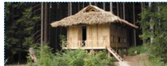
Wildniscamp Bayerischer Wald, Foto: Rita Gaidies

Unterwegs über verschiedene Höhenstufen auf bis zu 3.000 m, Hüttenzauber mit Alpenglühern auf 2.100 m, Informationszentren „Nationalpark Welten“ und „Wasser Welten“